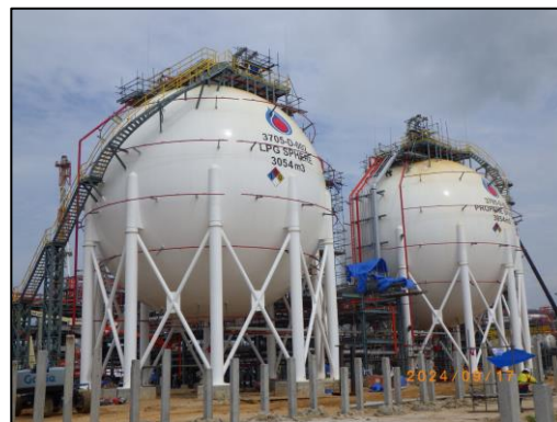
งานโครงสร้างถังกักเก็บผลิตภัณฑ์