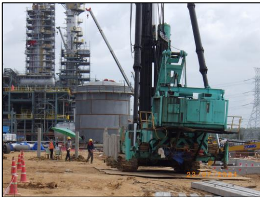
งานตอกเสาเข็ม