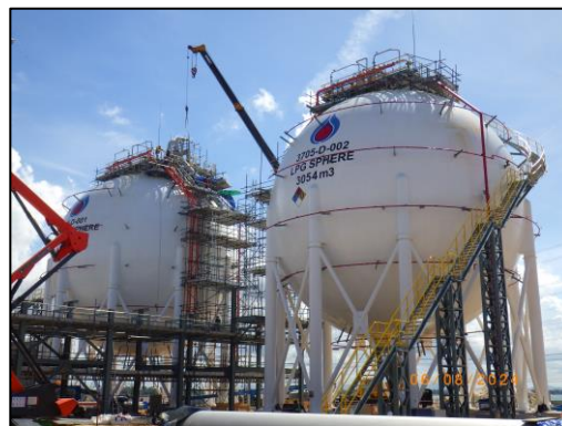
งานโครงสร้างถังเก็บผลิตภัณฑ์