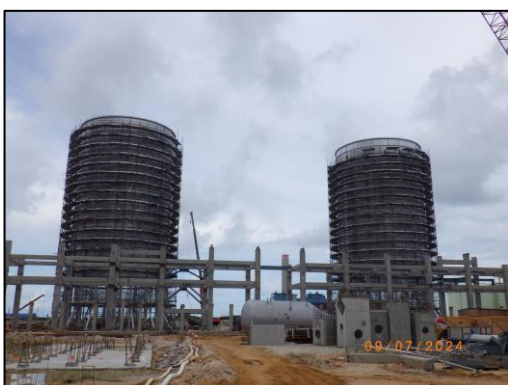
งานโครงสร้างหอผากระดับพื้นดิน