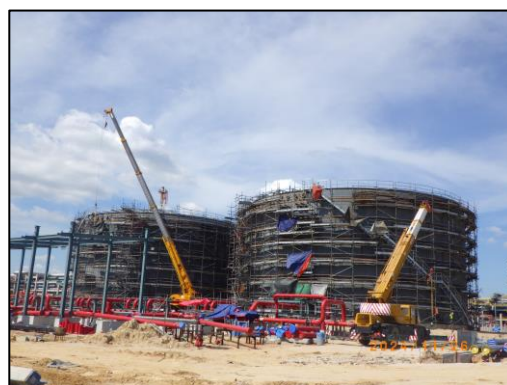
งานโครงสร้างถังสำรองน้ำดับเพลิง