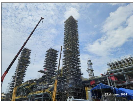
งานติดตั้งหอกลั่น (Gas Column Installation)