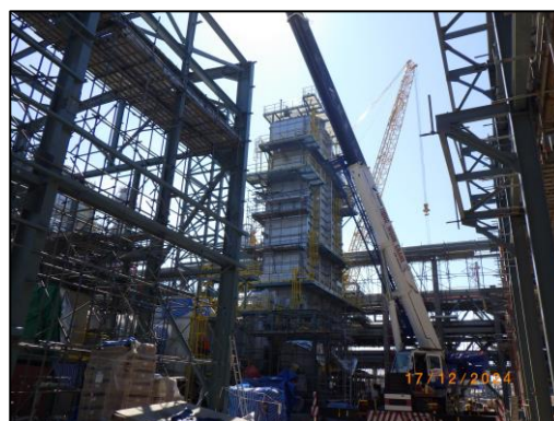
งานติดตั้งหน่วยหมุนเวียนพลังงานความร้อนเหลือทิ้งกลับคืน