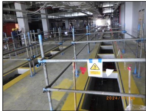
งานก่อสร้างอาคารควบคุม