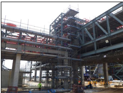
งานโครงสร้างชั้นวางท่อ (Pipe-Rack)