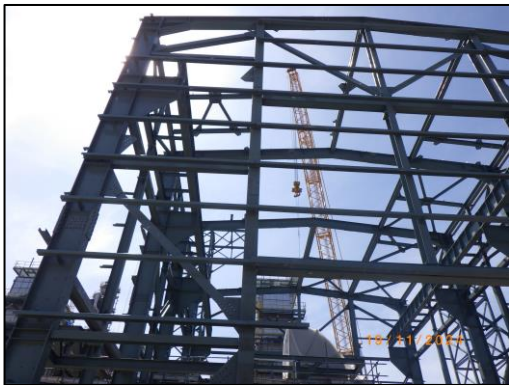
งานโครงสร้างอาคารเครื่องกำเนิดไฟฟ้า