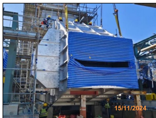
งานติดตั้งหน่วยหมุนเวียนพลังงานความร้อนเหลือทิ้งกลับคืน