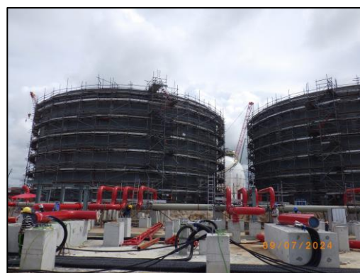
งานโครงสร้างถังสำรองน้ำดับเพลิง