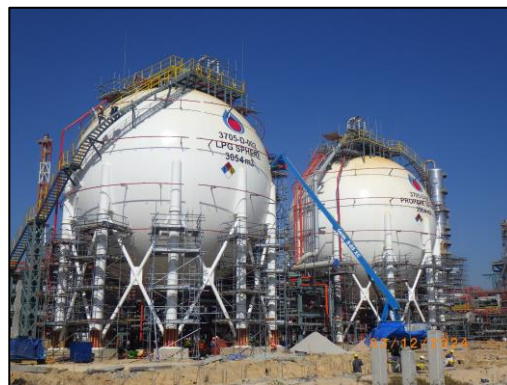
งานโครงสร้างถังกักเก็บผลิตภัณฑ์