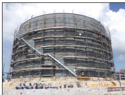
งานโครงสร้างถังสำรองน้ำดับเพลิง