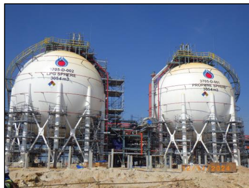
งานโครงสร้างถังกักเก็บผลิตภัณฑ์