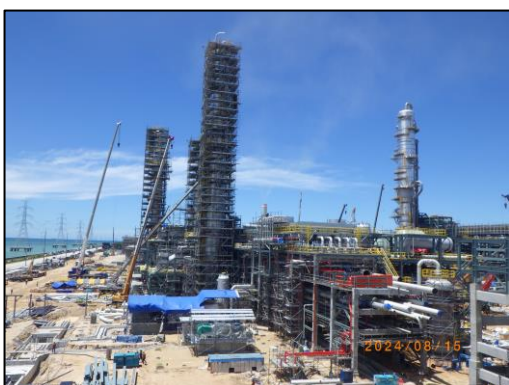
งานติดตั้งหอกลั่น (Gas Column Installation)