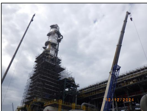
งานติดตั้งหอกลั่น (Gas Column Installation)