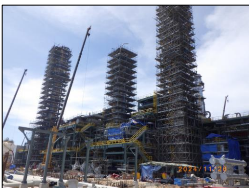
งานติดตั้งหอกลั่น (Gas Column Installation)