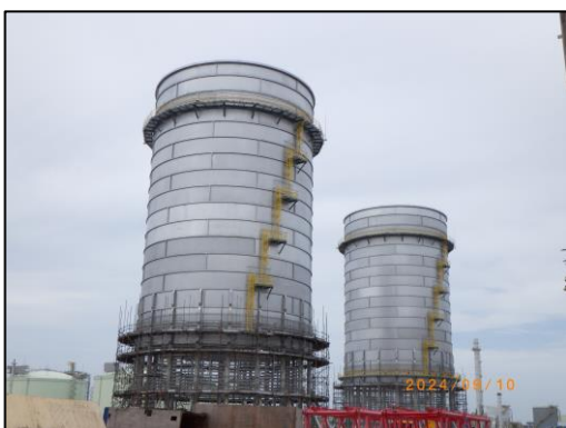
งานโครงสร้างหอเผาระดับพื้นดิน