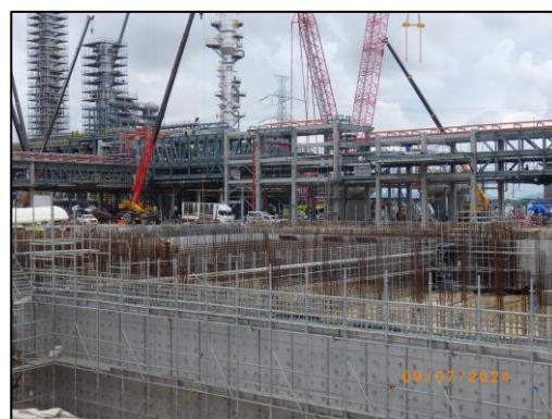
งานโครงสร้างถังรวบรวมน้ำทิ้งของโครงการ