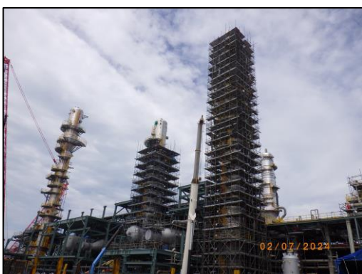
งานติดตั้งหอกลั่น (Gas Column Installation)