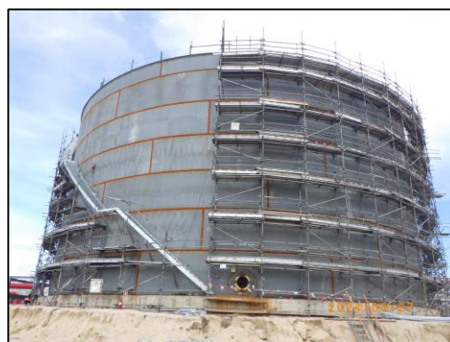
งานโครงสร้างถังสำรองน้ำดับเพลิง