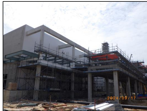
งานก่อสร้างอาคารควบคุม