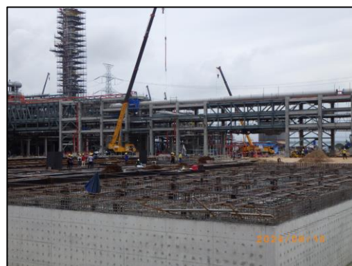
งานโครงสร้างถังรวบรวมน้ำทิ้งของโครงการ