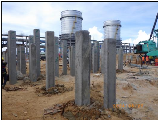
งานตอกเสาเข็ม