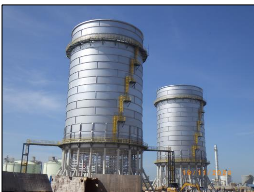
งานโครงสร้างหอเผาระดับพื้นดิน