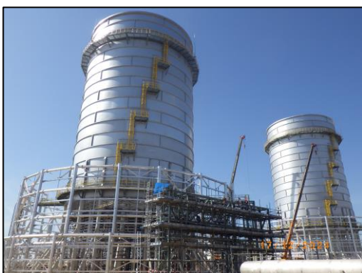
งานโครงสร้างหอเผาระดับพื้นดิน