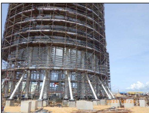
งานโครงสร้างหอเผาระดับพื้นดิน