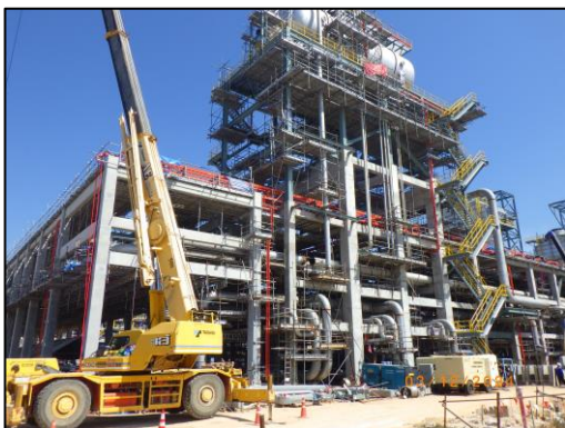
งานโครงสร้างชั้นวางท่อ (Pipe-Rack)