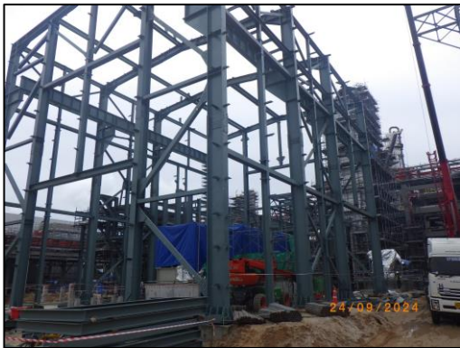
งานโครงสร้างอาคารเครื่องกำเนิดไฟฟ้า