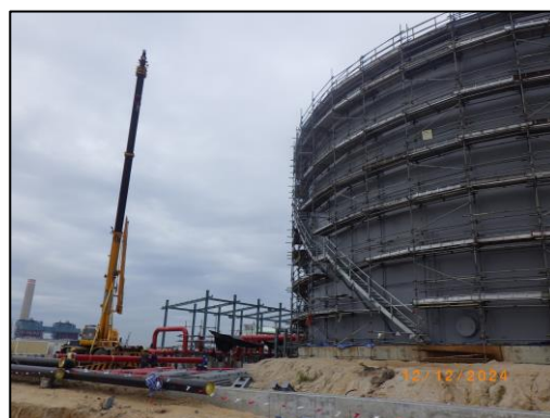
งานโครงสร้างถังสำรองน้ำดับเพลิง