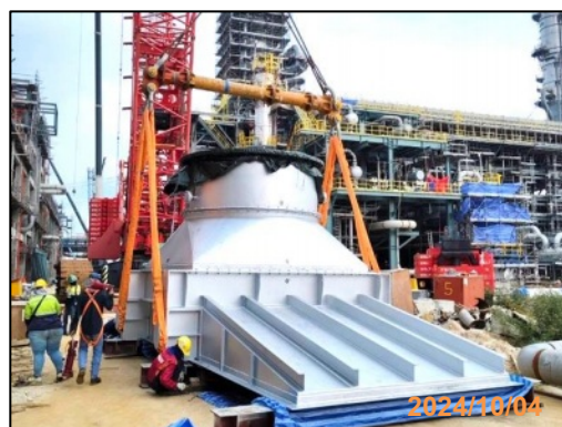
งานติดตั้งหน่วยหมุนเวียนพลังงานความร้อนเหลือทิ้งกลับคืน

รูปที่ 1-5 กิจกรรมก่อสร้างในเดือนตุลาคม พ.ศ. 2567