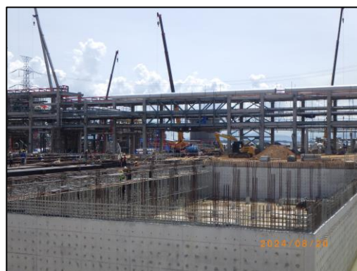
งานโครงสร้างถังรวบรวมน้ำทิ้งของโครงการ

รูปที่ 1-3 กิจกรรมก่อสร้างในเดือนสิงหาคม พ.ศ. 2567