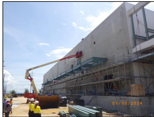
งานก่อสร้างอาคารควบคุม