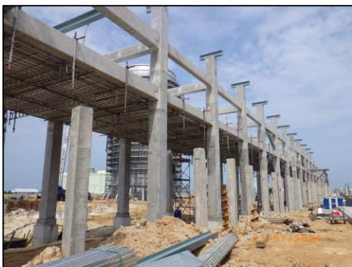
งานโครงสร้างชั้นวางท่อ (Pipe-Rack)