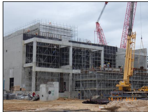
งานก่อสร้างอาคารควบคุม