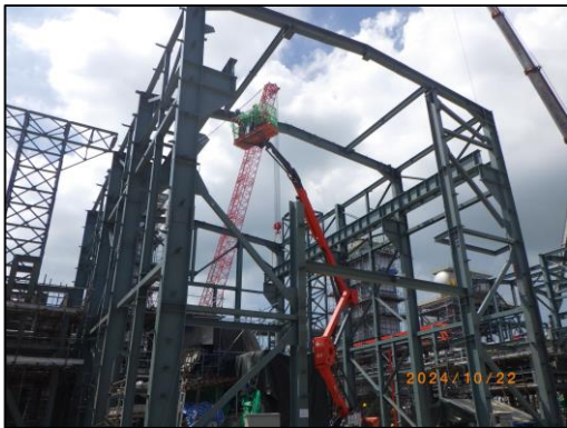
งานโครงสร้างอาคารเครื่องกำเนิดไฟฟ้า