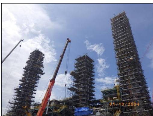
งานติดตั้งหอกลั่น (Gas Column Installation)