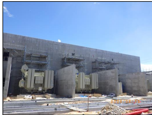
งานก่อสร้างอาคารควบคุม