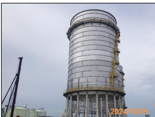
งานโครงสร้างหอเผาระดับพื้นดิน