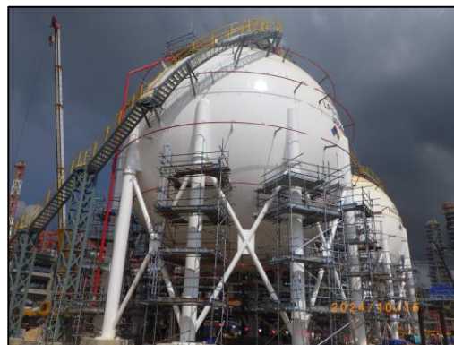
งานโครงสร้างถังกักเก็บผลิตภัณฑ์