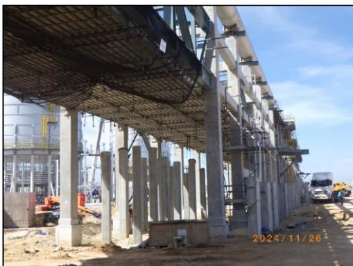
งานโครงสร้างชั้นวางท่อ (Pipe-Rack)