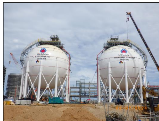
งานโครงสร้างถังกักเก็บผลิตภัณฑ์