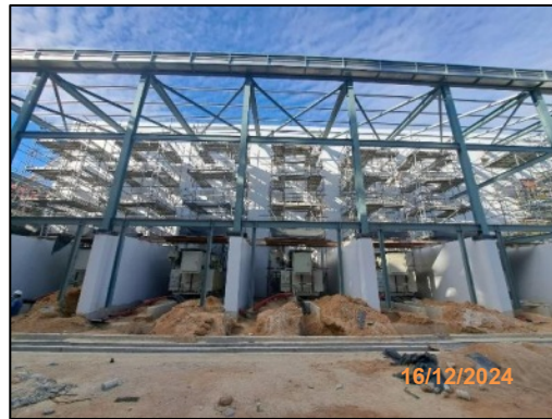
งานก่อสร้างอาคารควบคุม