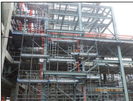
งานโครงสร้างชั้นวางท่อ (Pipe-Rack)