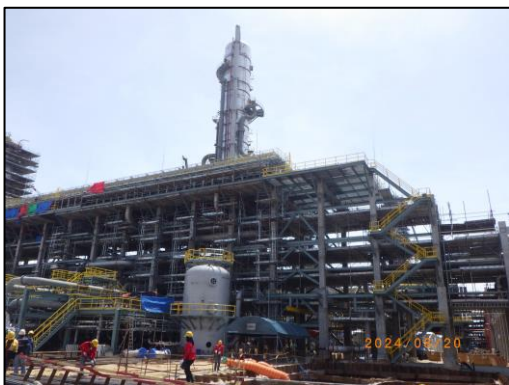
งานโครงสร้างชั้นวางท่อ (Pipe-Rack)